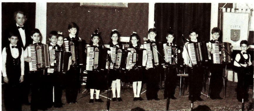
Il complesso "Minifisharmony" di Teramo, 1º assoluto della Cat. 29ª.