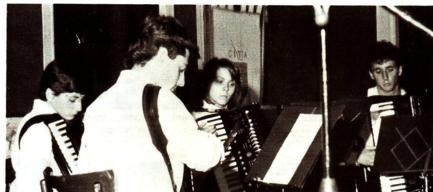
Il quartetto ACMU di Terni, 1º assoluto della Cat. 9ª.